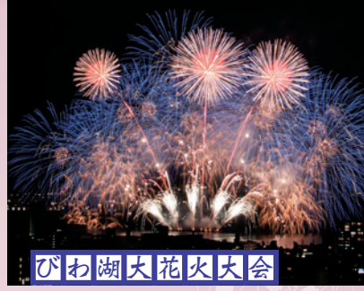
びわ湖大花火大会