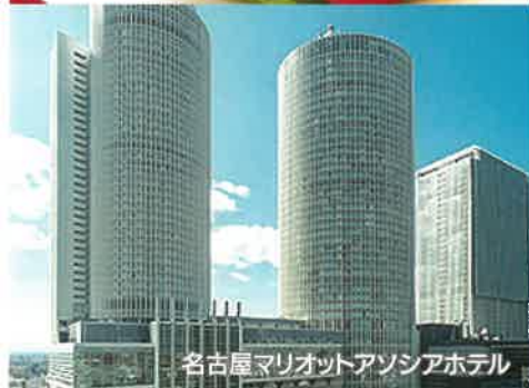
名古屋マリriottアソシアホテル